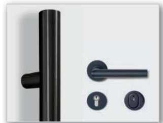
Integrierter Stangengriff / schwarz Feinstruktur (Verfügbar Längen: 600 - 1.600 mm) Innendrücker inkl. Kernziehschutz-Rosette