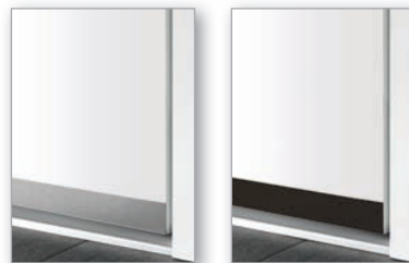
Edelstahloptik, glatt; 30 mm hoch, Art. 2.105.03