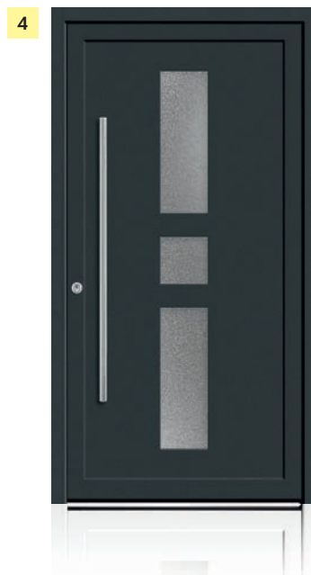
3 dura smart 2805-92 fü mit einseitiger Profilierung außen Farbe: weiß Stangengriff: schwarz mit Feinstruktur (ähnl. RAL 9005), 800 mm Sockelblende: schwarz mit Feinstruktur (ähnl. RAL 9005), 30 mm, Art. 2.205.03