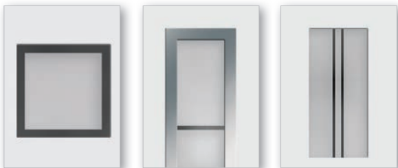
... mit klarem Rand (G500-25 / G505-25)