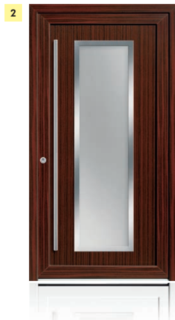
1 dura smart 2810-92 fü mit einseitiger Profilierung außen Folierung: anthrazitgrau, glatt Stangengriff: Edelstahl, 1.600 mm