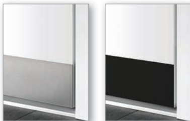
Edelstahloptik, glatt; 90 mm hoch - bei einwärts / 110 mm hoch bei auswärts, Art. SBFIX-IV