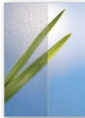
Orna 504, weiß