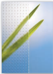
Master Carreé, weiß